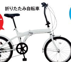
折りたたみ自転車