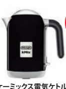
ケミックス電気ケトル