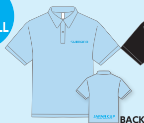
T/Cポロシャツ 1枚 4,000円(税込) ●サックス ●ブラック