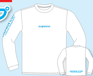
ドライロングスリーブTシャツ 1枚 4,000円(税込) ●ホワイト ●アーミーグリーン